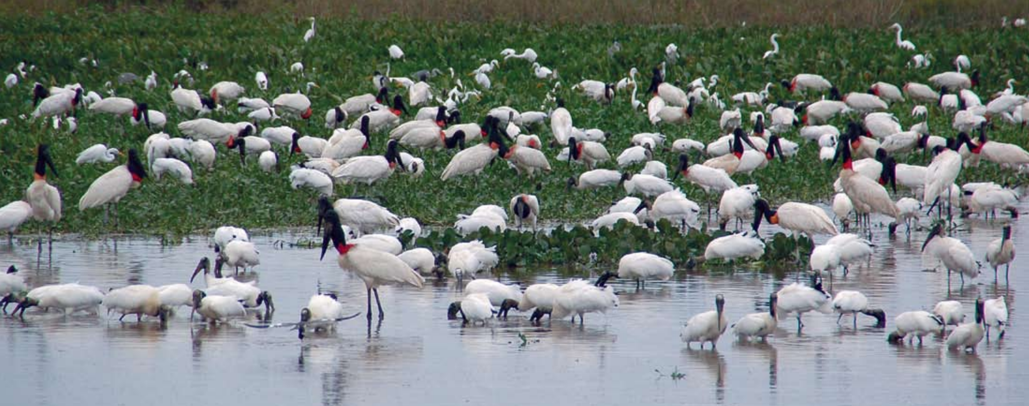
Quando as águas baixam, multidões de aves fartam-se de peixes nas poças isoladas