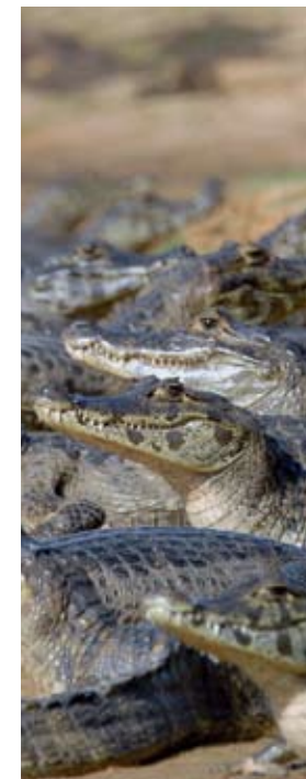
Os jacarés descansam em grupos